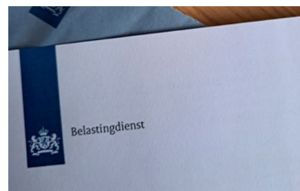
3 Ondernemingen en ondernemers